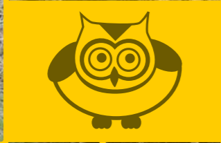
Cursa Nautica Planetaria de Șeșușă Pallareșă